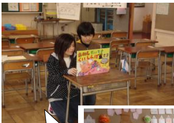
紙芝居の 読み聞かせ

この交流が終わっても、休み時間やたてわり班活動などで1年生のお世話をする子供たちの姿を期待しています。