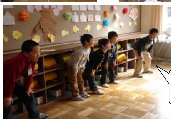
ドンドコドンドコ 猛獣狩りゲーム