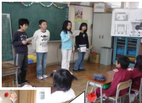
なぜなぜ クイズ大会