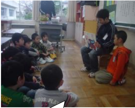
紙しばいの読み聞かせ